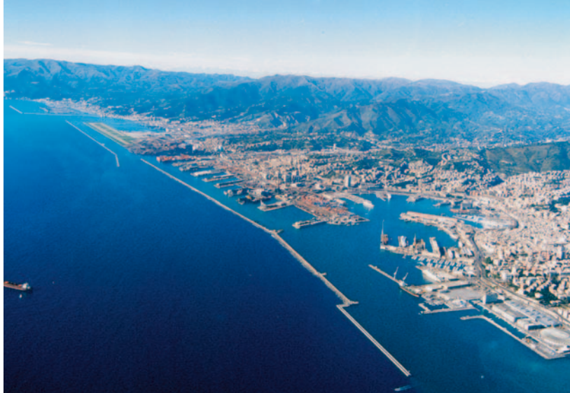
FIG. 1. — Vue panoramique du port de Gênes